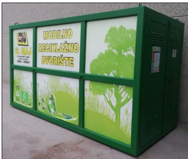
Slika 1. Mobilno reciklažno dvorište

Na području Općine Grožnjan se proteklih godina pružala usluga mobilnog reciklažnog dvorišta prema rasporedu korištenja mobilnog reciklažnog dvorišta komunalne tvrtke 6. MAJ d.o.o. Mobilno reciklažno dvorište opremljeno je opremom za vaganje prikupljenog otpada te ima djelatnika koji je zadužen za vaganje, odlaganje i vođenje evidencija o posjedniku otpada. Odlaganje otpada je besplatno, a osoba koja donosi otpad mora pokazati osobnu iskaznicu djelatniku, kako bi upisao podatke o posjedniku otpada.